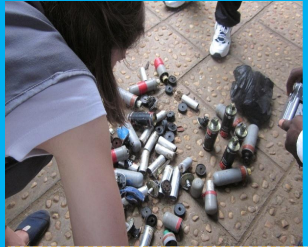
Douilles de Gaz lacrymogènes lancées sur les étudiants de l'Université de Lomé courant Mai-Juin 2011. Halte à la répression. Oui à la liberté de manifestation