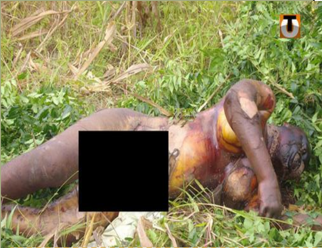
Corps d'une jeune fille de 16 ans tuée à Agoé en octobre 2011 (GOLFE, LOME-TOGO). Non à l'insécurité ambiante. Oui à la vie et à la sûreté des personnes

Prix de l'Edit de Nantes en novembre 1993