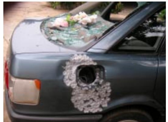
La voiture d'une enseignante à l'Université de Lomé, criblée de balles, dans sa maison, par les miliciens du RPT, visiblement dans l'intention de la brûler, sans succès.