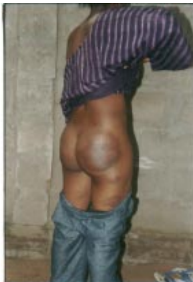
Une dame, fessée dans sa maison par les militaires, à Ablogamé.